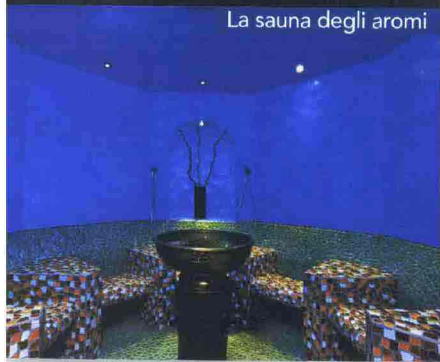
La sauna degli aromi

Nella zona Acqua e Fuoco ci sono grotte, piscine con acqua salina e vari tipi di saune, dalla Caligo simile a un bagno turco con il 98 per cento di umidità alla sauna degli aromi, più leggera, secca e aromatizzata agli oli essenziali.