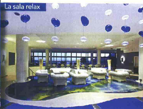
La sala relax