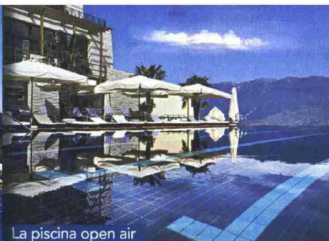
La piscina open air