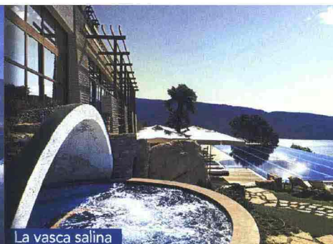
La vasca salina