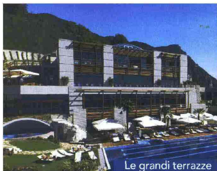
Le grandi terrazze